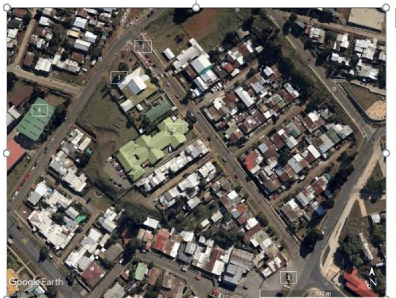
Figura 3. Imagen satelital del área de interés: 1 empresa de almacenamiento y distribución de carnes; 2 el centro de atención primaria de salud; 3 jardín infantil; 4 colegio y 5 comercio informal en las veredas; utilizando Google Earth ©

La fig. 3, ilustra un centro de atención primaria de salud, con relación a zonas de mayor densidad de ataques por mordeduras y componentes ambientales urbanos.